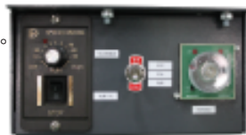
控制箱 SC-1(连续、间歇、可变速运转) コントロールBOX SC-1(連続、間欠及び可变速運転) control box SC-1 (Consecutive、Intermittent and Variable Speed Operation)