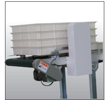
拆垛单元 段ばらしユニット Separator Unit