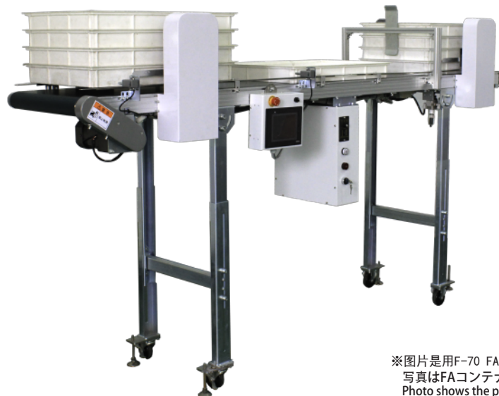
※图片是用F-70 FA物料箱时的排列机。 写真はFAコンテナF-70仕様機です。 Photo shows the product with F-40 specification FA container.